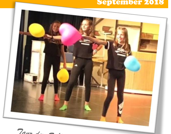
Tanz der Schülerinnen aus der 7G2