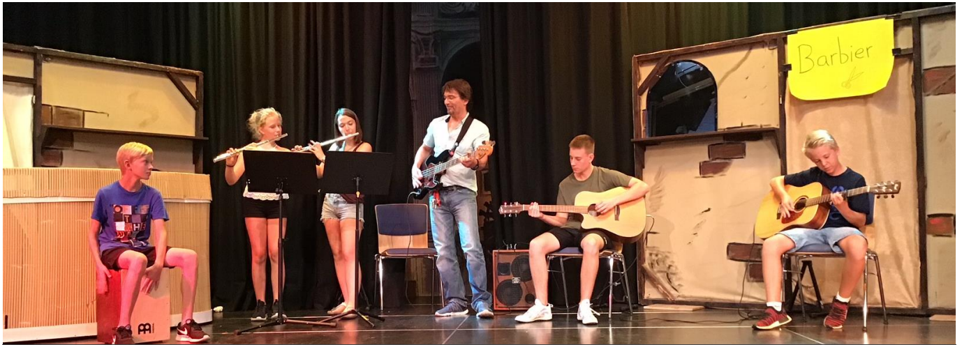
Die Schulband begrüßt die neuen Fünftklässler bei hochsommerlichen Temperaturen